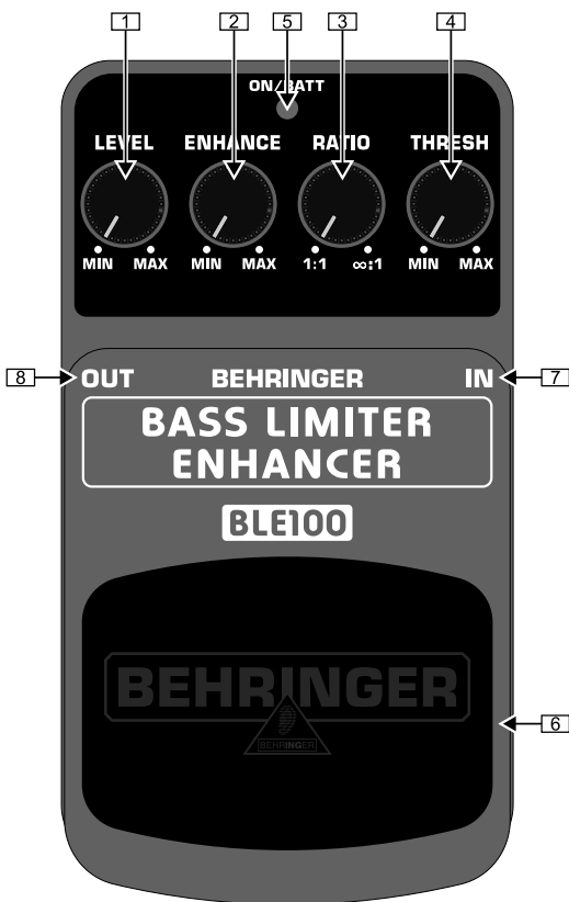
Обзор верхней части