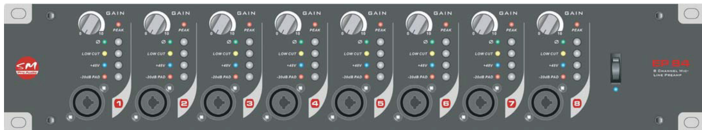
Передняя панель предусилителя EP84

С каждой стороны передней панели предусилителя имеются надежные крепежные проушины для монтажа на стойке. Просто установите предусилитель на стойку в доступное место высотой 2 стойко-места и закрепите его болтами/винтами.